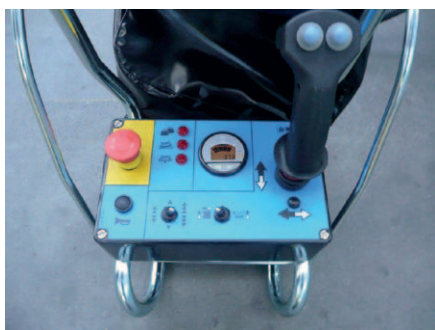
Quadro comandi sulla piattaforma semplice e intuitivo