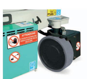
Sterzo idraulico a 90°