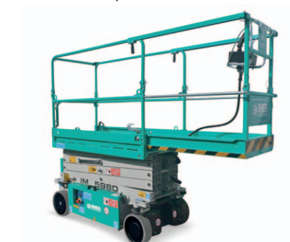
Estensione manuale piattaforma 1 m